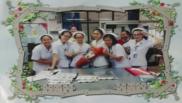
1. ประชุมเพื่อระดมสมองและ หาแนวทางปฏิบัติร่วมกัน