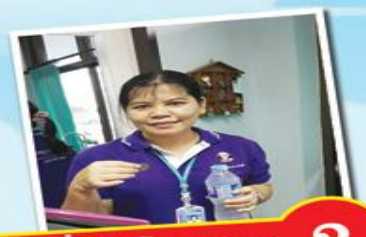
2 หลังเริ่มทำโครงการ