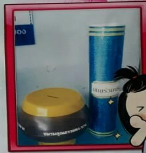
2. ทำกล่องรับบริจาคเข้า กองทุนช่วยเหลือผู้ป่วยที่ขาดแคลน พร้อมทั้งประชาสัมพันธ์ให้ผู้รับบริการทราบ