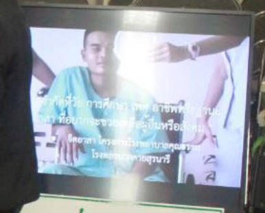
โรงพยาบาลค่ายสุรนารี

Group of women in professional attire, one is taking a photo with a smartphone. They are engaged in a discussion.