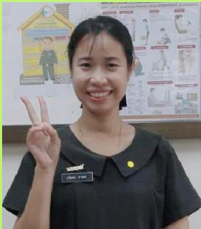
พ.ต.หญิงธวัลพร ชาเสน รอง ทน. สิทธิประโยชน์และจัดเก็บรายได้

“วิธีแก้ไขความอึดอัดใจในการทำงาน คือ การยอมรับ ความแตกต่าง ความเป็นปัจเจกบุคคล”