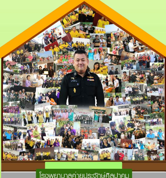
โรงพยาบาลค่ายประจักษ์ศิลปาคม