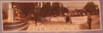
วันที่ ๒๘ กุมภาพันธ์ ๒๕๕๘ รับประกาศคุณธรรม โรงพยาบาลคุณธรรม ณ โรงพยาบาลศรีสวาลัย