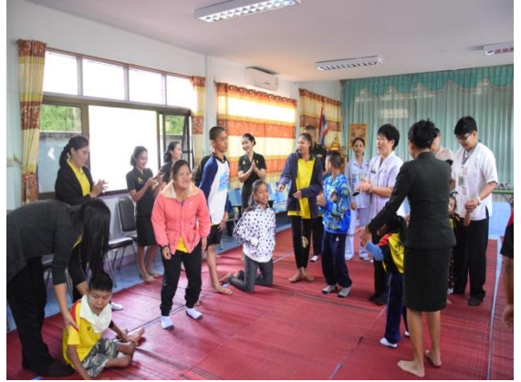
● ประกาศโรงพยาบาลคุณธรรม