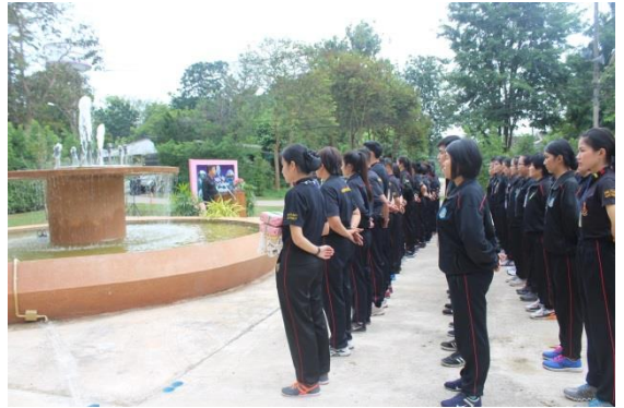
● โครงการอบรมคุณธรรม จริยธรรม ประจำเดือน