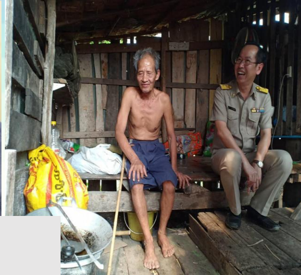
ชม แשר์ เชียร์ ช่วย เชื่อม