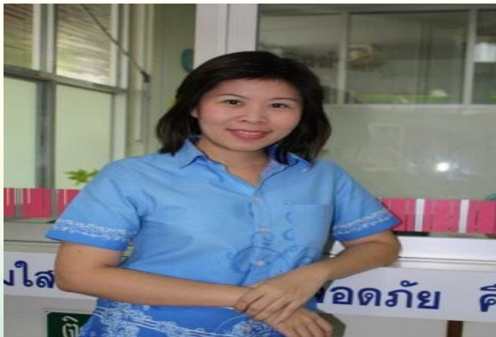
ข้าราชการพลเรือนดีเด่น ปี 2561