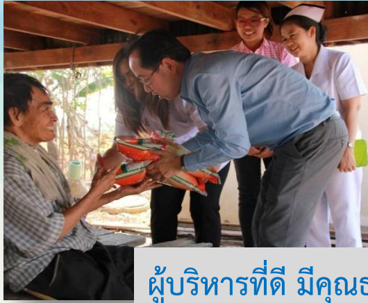
ผู้บริหารที่ดี มีคุณธรรม ปี 2562