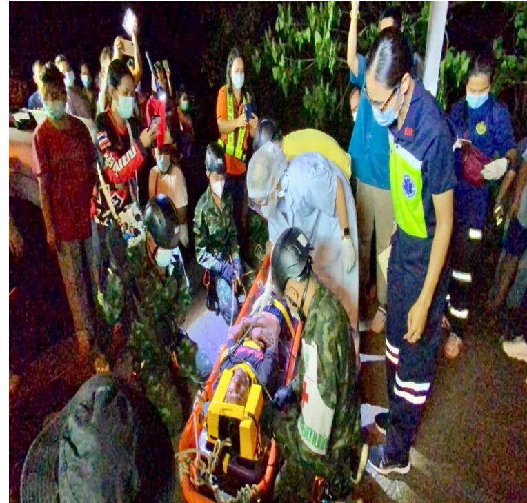
รับผิดชอบต่อผู้ป่วย